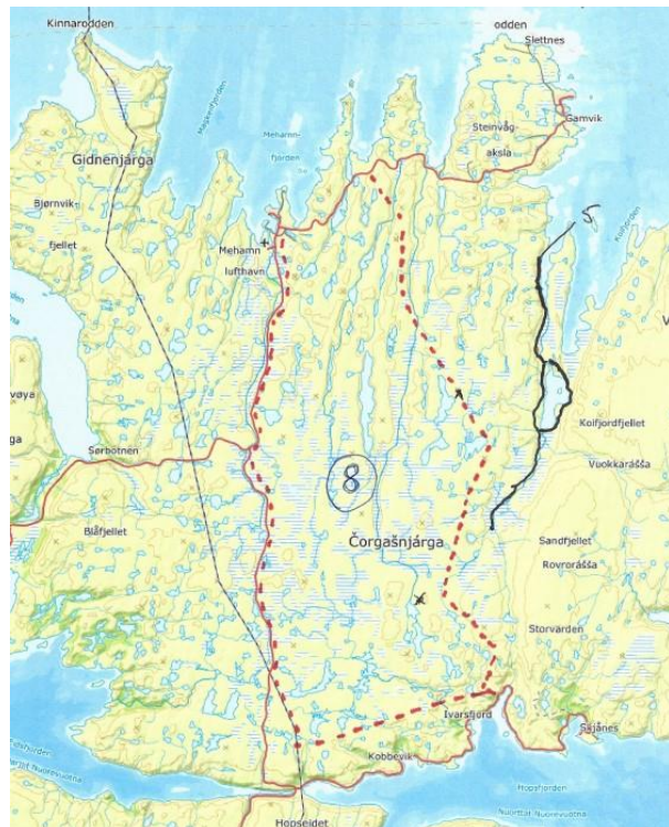
Nordkyn, stort turområde uten tilrettelegging.

I denne revisjonen har kommunen lagt vekt på å unngå Akersjøen, som fremstår som et viktig område for friluftslivsinteresser også på