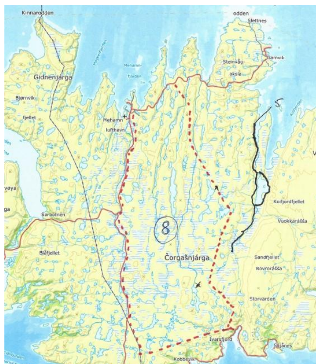
Nordkyn, stort turområde uten tilrettelegging.

Noen friluftslivsinteresser ønsker også scootertraséer enkelte steder. Mehamn helsesportsforening har ønsket scooterspor fra hjelpekorpshytta og opp til Fjellstua, for å gjøre traséen lettere fremkommelig for