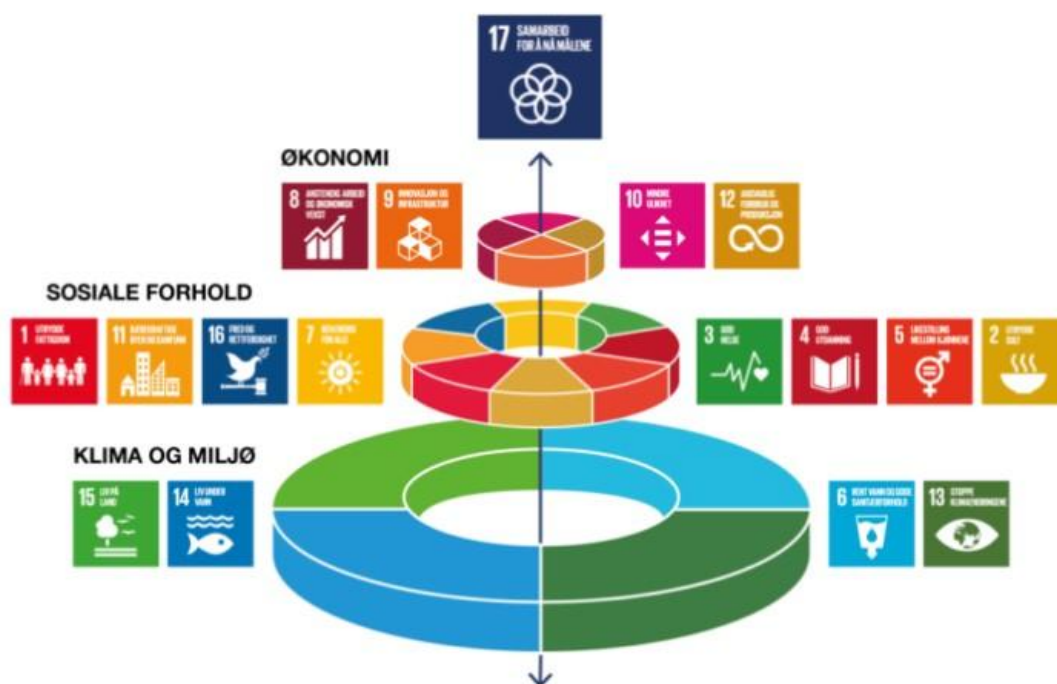
Figur 1. FNs bærekraftsmål. Henta fra "Folke et al.» (2016)

«Nasjonale forventninger til regional og kommunal planlegging» vedtas gjennom Kongelig resolusjon hvert fjerde år, sist 20. juni 2023. Sammen med FNs 17 bærekraftsmål er det valgt ut fem overordna perspektiver som skal ligge til grunn for fylkeskommunenes og kommunenes planlegging.