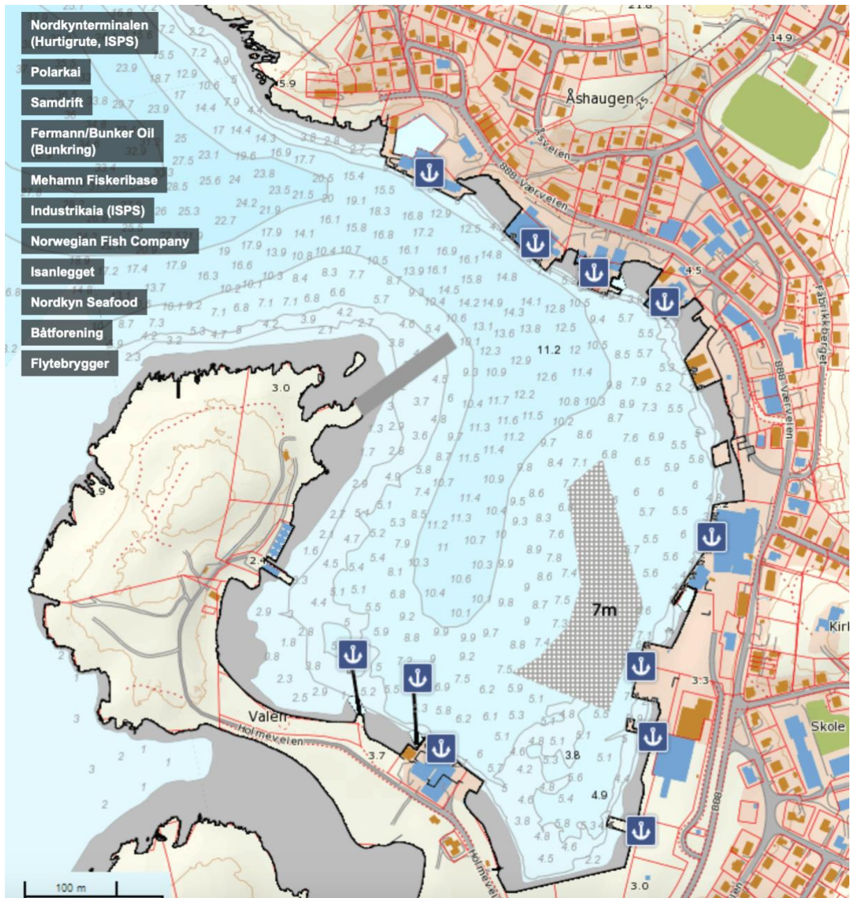
Detaljert dybdekart for Mehamn havn