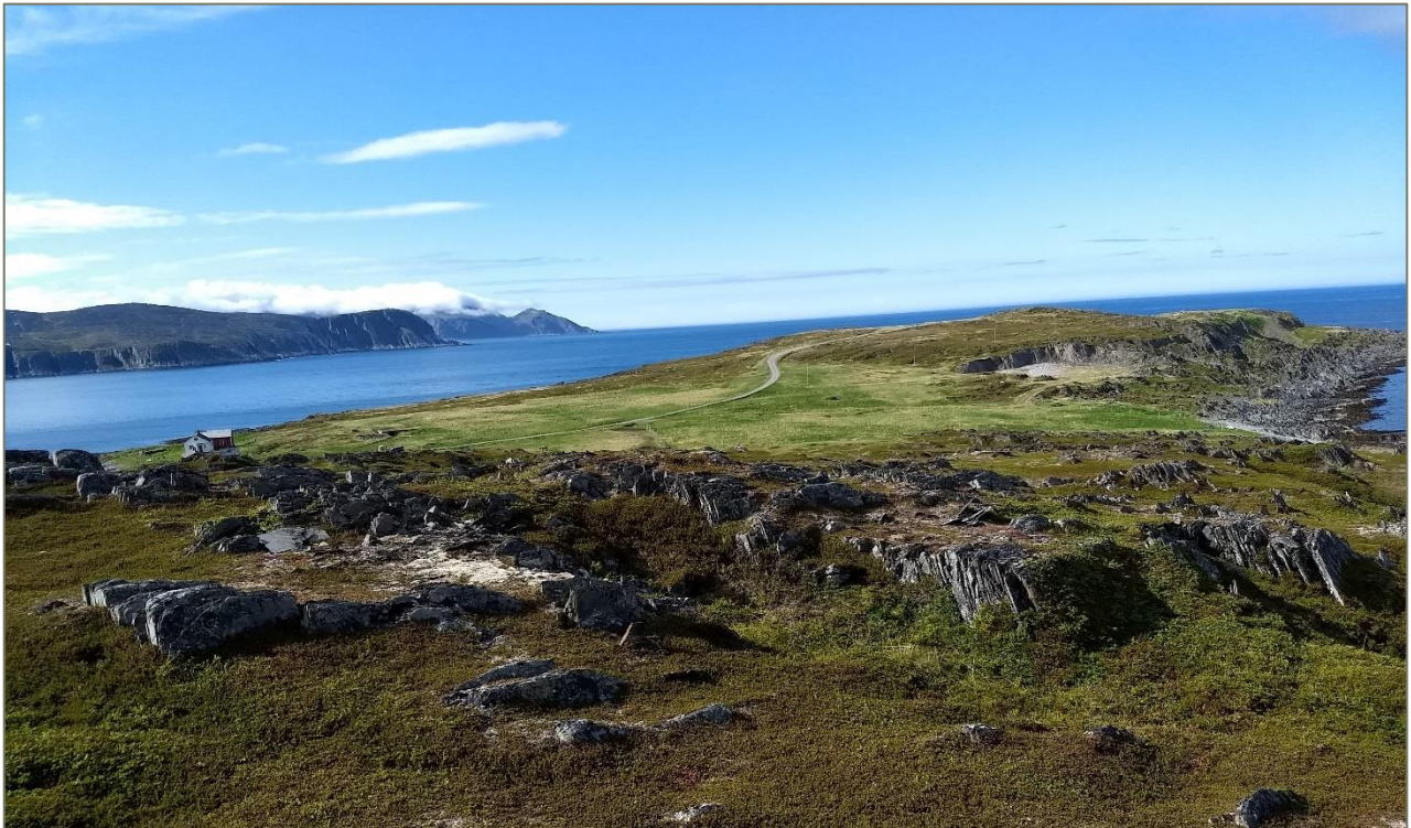
Figur 2. Vevikneset sett fra Mehamnhaugen.