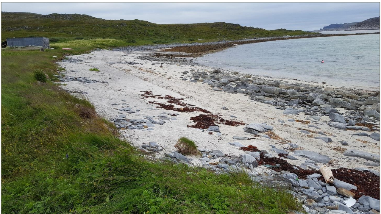
Figur 3. Sandstrand innerst i Normannsetpollen.