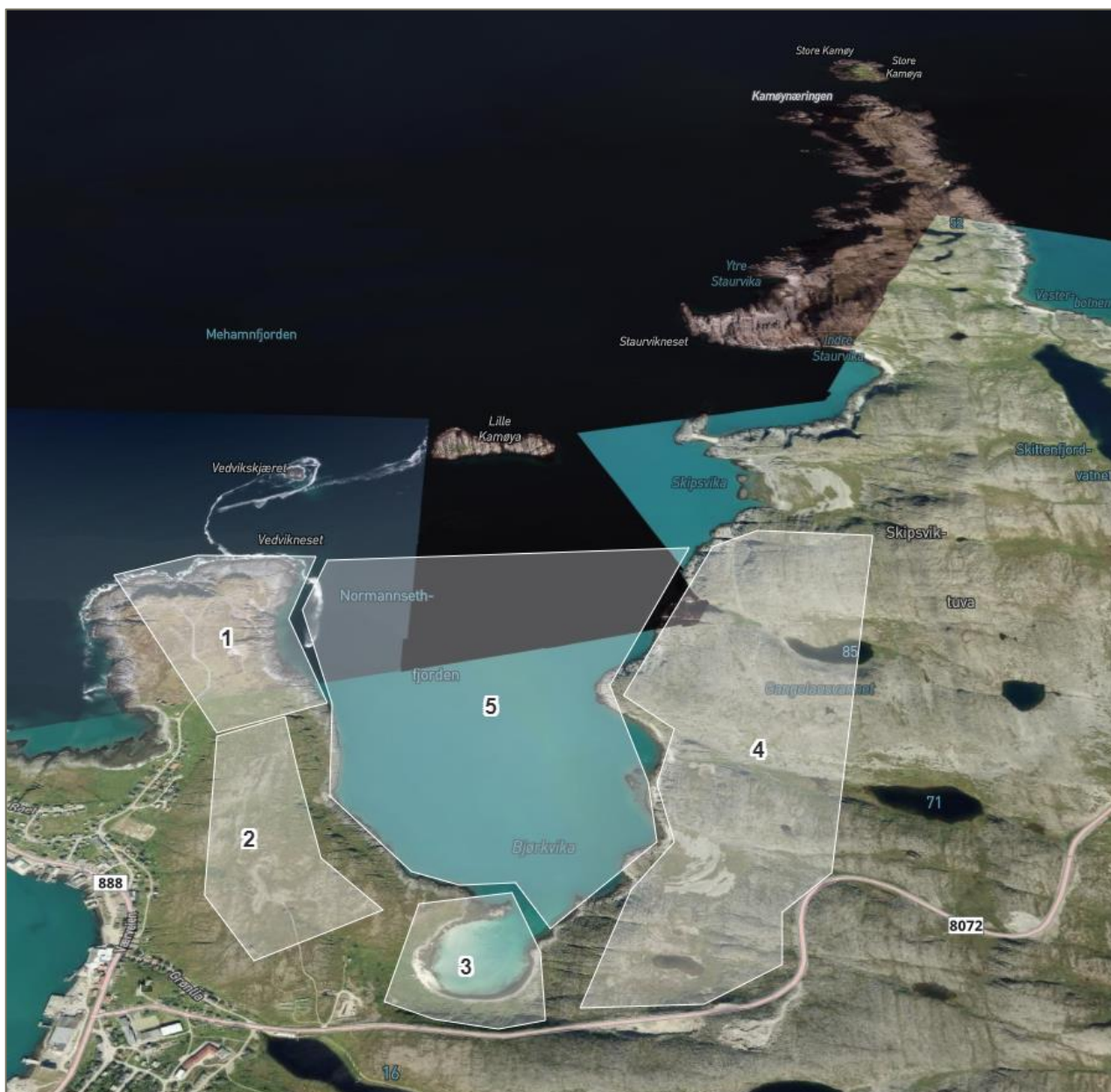
Figur 5. Plan- og influensområdet inndelt i delområder for fagtemaet (delområde 5 inkluderer også Vedvikskjæret og Lille Kamøya)