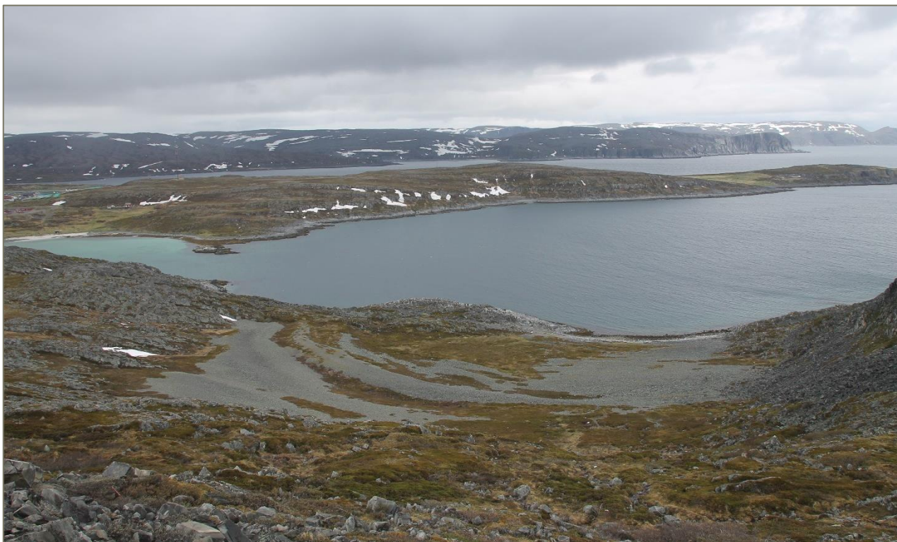
Figur 1. Oversiktsbilde Normannsetfjorden sett ovenfra Bjørkvika.

Det legges til grunn av bruken av Normannsetfjorden i sjø har noe mindre bruksfrekvens, men at området er egnet til f.eks. sportsfiske. Pollen innerst har naturlig sandstrand og ligger relativt skjermet til.